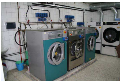
Local técnico (lavandería).